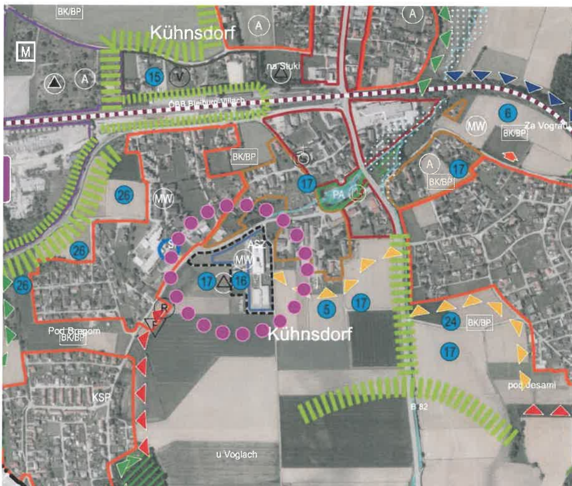
Graphik 02: Auszug ÖEK 2013